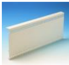
Dekoratyvinis elementas E