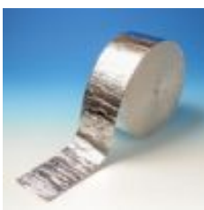
Reflektorinė juosta HT