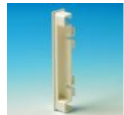
Grandinės užbaigimas H